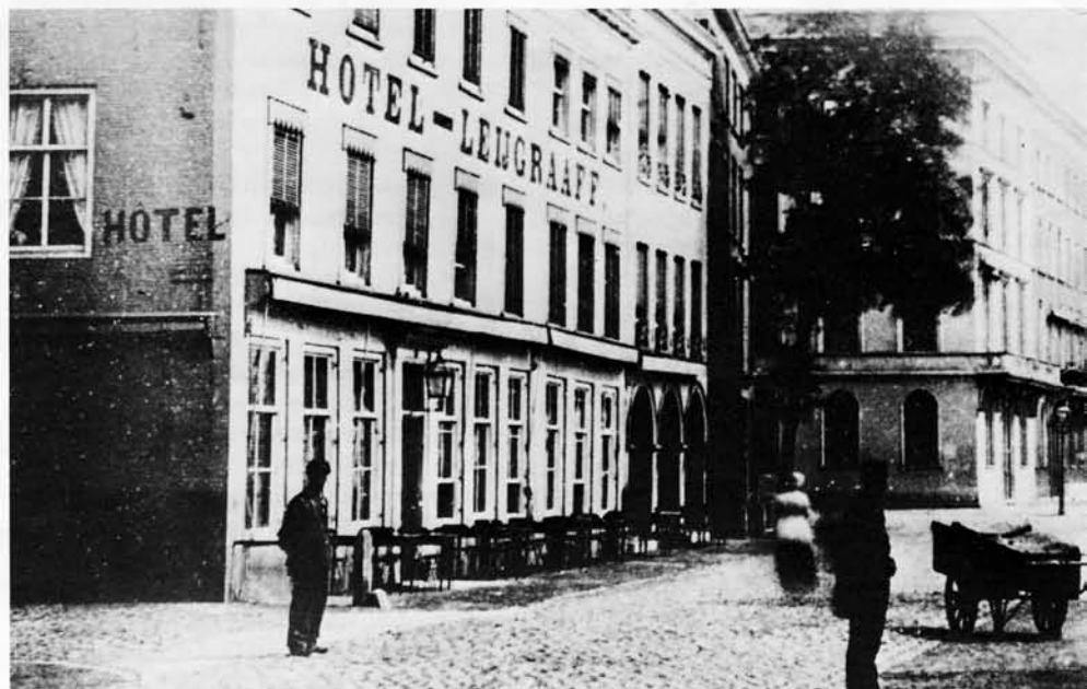
In 1878 was Hotel Leygraaff aan het Westplein al een eigen elektrische installatie rijk. Daarmee verlichtte het de hoteltuin.

van particulieren en het was een onenigheid met één van die particulieren die leidde tot het genoemde incident. De NEM zag zich gedwongen de kabel om te leiden via gemeentegrond en had daarvoor opnieuw de toestemming van het gemeentebestuur nodig. De medewerking van die kant was echter groot zodat het licht een maand later weer terugkeerde in de Passage.