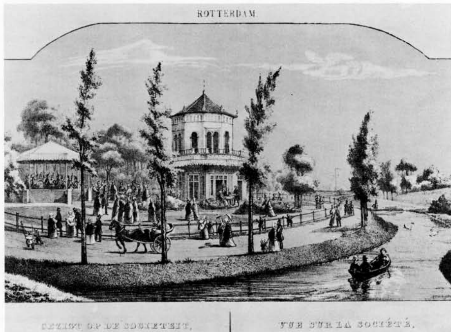
In 1881 werd bij de officierensociëteit in het Park een demonstratie gegeven met elektrisch licht.

bracht toen zoveel mensen op de been dat met recht van een opstootje gesproken mag worden.