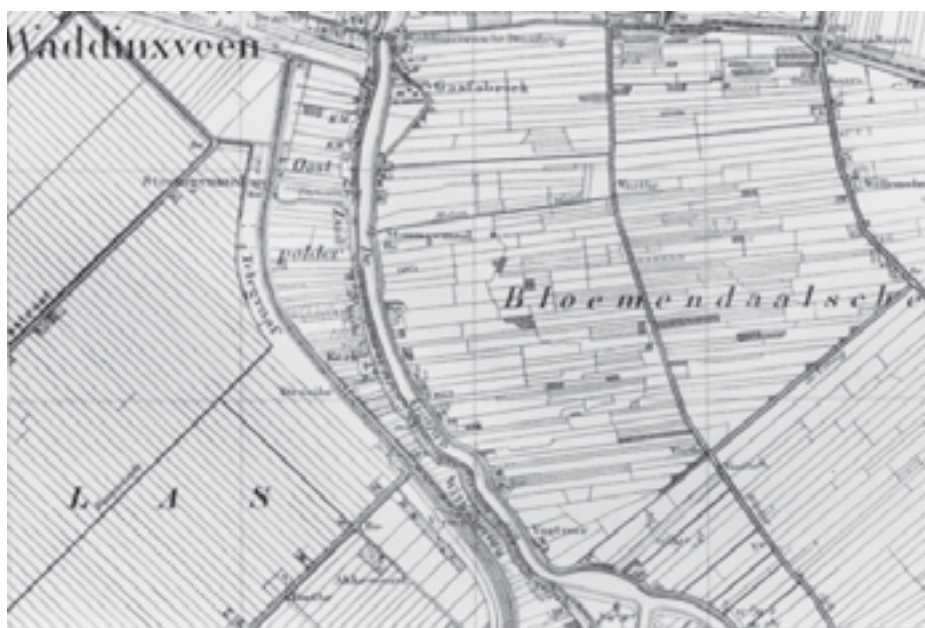
Afb. 1. Topografie van het gebied aan weerszijden van de Gouwe ten noorden van Gouda. Aan de oostzijde van de Gouwe en in een smalle strook ten westen van de Gouwe is de structuur van de Middeleeuwse verkaveling nog aanwezig. Ten westen van de Gouwe vindt men de rationale verkaveling van een droogmakerij. Hier werd reeds in de middeleeuwen turf gestoken. In de 17e en 18e eeuw is dit gebied ten behoeve van de veenwinning tot op de onderliggende kleilaag uitgebaggerd. Het toen ontstane meer is in de eerste helft van de 19e eeuw drooggemalen.

die regelgeving. Enerzijds had hij namelijk de inkomsten uit de turfmaat, dus uit de belasting op de hoeveelheid gegraven turf, anderzijds had hij als baljuw de inkomsten uit de overtredingen op de toegestane hoeveelheden te winnen turf. Ter verdediging voor de baljuw valt aan te voeren dat dergelijke situaties haast onontkoombaar waren door de dan nog bestaande vereniging van uitvoerende en rechtsprekende macht in één persoon. Pas na het midden van de zestiende eeuw is onder druk van de hoogheemraden, eerst in Schieland en daarna in Rijnland, de turfmaat gescheiden van het baljuw-dijkgraafschap. Het ligt voor de hand dat de desastreuze gevolgen van het slagturven daarbij de directe aanleiding vormden. Vanaf dan wordt de turfmaat door de landsoverheid dorpsgewijze verpacht. 6