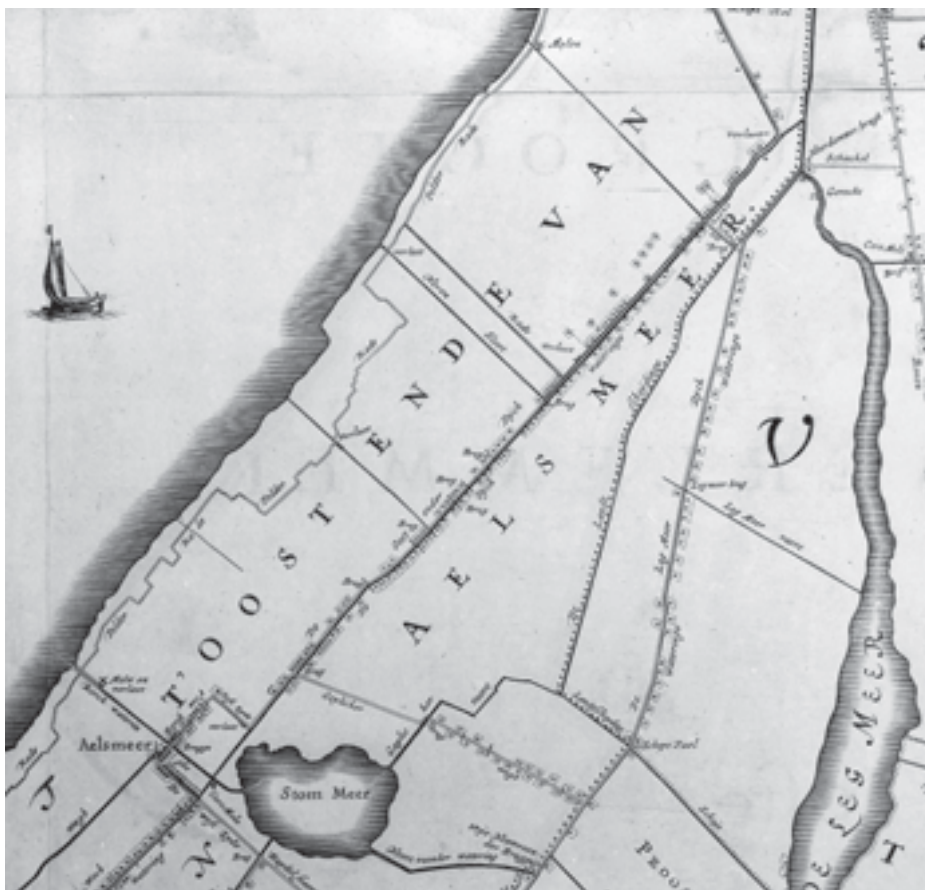
Afb. 3. Detail van de kaart van Jan Pietersz Dou en Steven van Broeckhuyzen uit 1647, blad 5, voorstellende een deel van de Generale bepoldering van Aalsmeer, namelijk 'het oosteinde van Aalsmeer' liggende tussen het Haarlemmeer en de grens van Amsteland, de Legmeer. Het gebied van de latere Oosteinderpolder is nog geheel land. (Kopergravure, hoogheerraadschap van Rijnland atlas 8).

land meer geld opbracht. Ook het krachtige centrifugaalgemaal kreeg een gunstig onthaal: dat hypermoderne type van bemaling lag speciaal de ingenieurs van de waterstaat zeer na aan het hart. Zelfs de hoofdopzichter van Rijnland, de oude Kros, had weinig waterstaatkundige bedenkingen en men leest tussen de regels van de onvermijdelijke bedenkingen ten aanzien van de Rijnlandse belangen diens schoorvoetende appreciatie. Dit zuiverde in zoverre de discussie dat die zich nu geheel kon concentreren op dat ene punt, de verkleining van Rijnlands boezem.