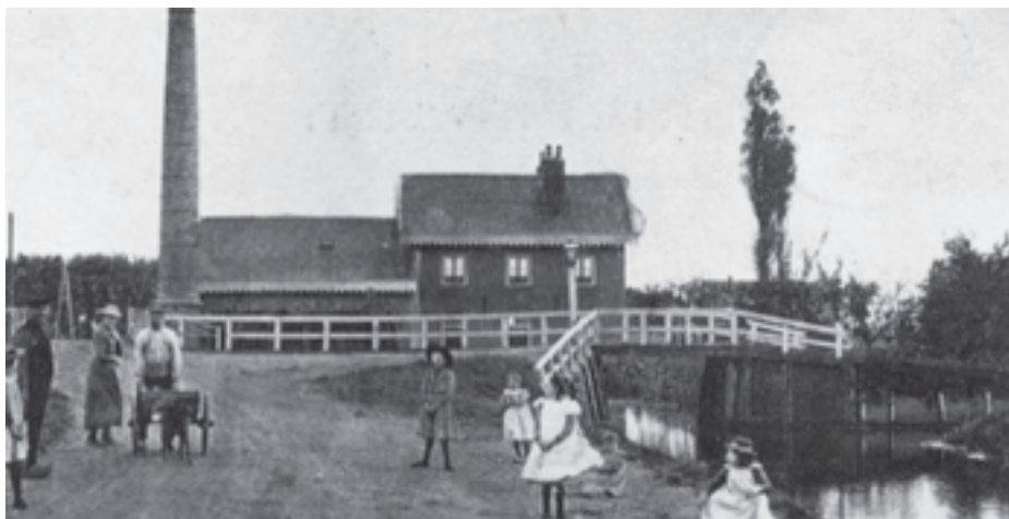
Afb. 2. Het stoomgemaal van de Oost-einderpoelpolder rond 1900.

de Legmeerdijk, die tussen het water van de poel en de (later ook drooggemaakte) Legmeerplassen een kwetsbare waterkering was. Dat deed ook de provincie, omdat meer landbouwgrond meer welvaart betekende. Kortom, er heerste blijdschap alom over dit prachtplan en die ging zelfs zover dat zowel het rijk als de provincie Noord-Holland het ondersteunden met een subsidie van f20.000 elk. De enige die niet meejuichte in het koor en dan ook de spelbreker zou worden was het hoogheemraadschap van Rijnland. Dat had zo zijn redenen.