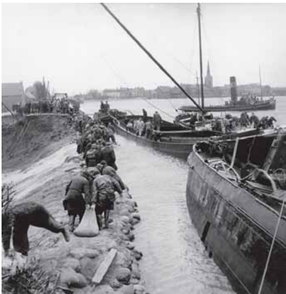
5. In de loop van de middag lukte het om het gat bij Ouderkerk aan den IJssel te dichten, waardoor een nog veel grotere ramp werd voorkomen. Slechts op twee andere plekken slaagde men er in om die eerste februari al de stroomgaten te dichten.

Maar deze constatering brengt ons nog niet tot de kern van de hele zaak. Zij verdoezelt andere, belangrijkere aspecten. Want het was niet in de eerste instantie een kwestie van geld. Het ging veeleer om visie, doortastendheid, organisatie, ambtelijke durf om beleid uit te stippelen en om politieke daadkracht. Feit is dat het werk van de Stormvloedcommissie niet werd voortgezet. Feit is dat die commissie die zoveel in relatief korte tijd had bewerkstelligd, een stille dood stierf. Feit is dat er geen werk meer werd gemaakt om het oppertoezicht handen en voeten te geven, dat het onderzoek geen aandacht meer kreeg, dat die opgedane kennis bleef opgeslagen in niet-openbare nota's en geheime rapporten en dat die kennis dus niet met belanghebbenden werd gedeeld.