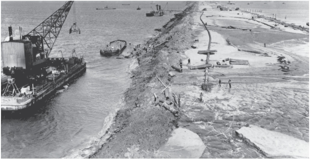
4. In september 1931 waren de werken aan de Afsluitdijk ver gevorderd. Om echter niet te grote winterschade op te lopen, werd dat najaar tot in december doorgewerkt (Foto: Rijkswaterstaat, Lelystad).

te versnellen om de werken niet al te veel winters aan de stormen bloot te stellen. In de zomer van 1931 bleek dat een oud probleem de kop had opgestoken: paalworm in de zinkstukken. De keuze was nu ofwel de zinkstukken repareren ofwel de geul, de Middelgronden, voor de winter afsluiten. Van Kuffeler koos voor het laatste en wist de MUZ en de minister ervan te overtuigen dat het de beste beslissing was. Het betekende dat er tot eind november gewerkt moest worden om de geul af te sluiten en de dam op hoogte te krijgen. ‘De slag om de Middelgronden’ noemde Thijssen het in zijn boek, want er moest zelfs dag en nacht gewerkt worden om de stroming baas te blijven. In mei 1932 kon het laatste gat worden gedicht en aan het afwerken van de Afsluitdijk worden begonnen. Een jaar later werd die opgeleverd en kon de balans worden opgemaakt van het werken met de MUZ. Hoewel hij enerzijds tevreden was over personeel en materieel, had Van Kuffeler toch al in 1929 duidelijk gemaakt dat hij niet verder wilde met de combinatie omdat die te duur was en het werktempo niet hoog genoeg lag. Dat meldde hij twee jaar later ook aan de minister, die zijn advies opvolgde en het contract niet verlengde. De MUZ zou voortaan de concurrentie met andere aannemers moeten aangaan.