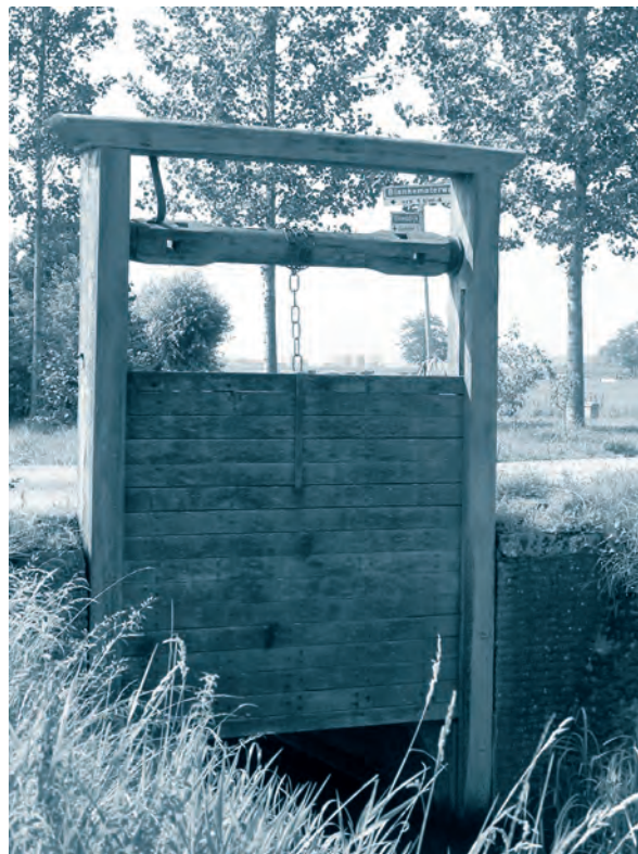
Afb. 6. Gerestaureerd zeventiende of achttiende-eeuws sluisje in de Vloeddijk bij Nijbroek.

Honderd jaar later, in 1470, werd een nieuw dijkrecht uitgevaardigd, op verzoek van de betrokken dorpen. Vergelijking van beide dijkrechten laat zien dat in hoofdzaken – be-