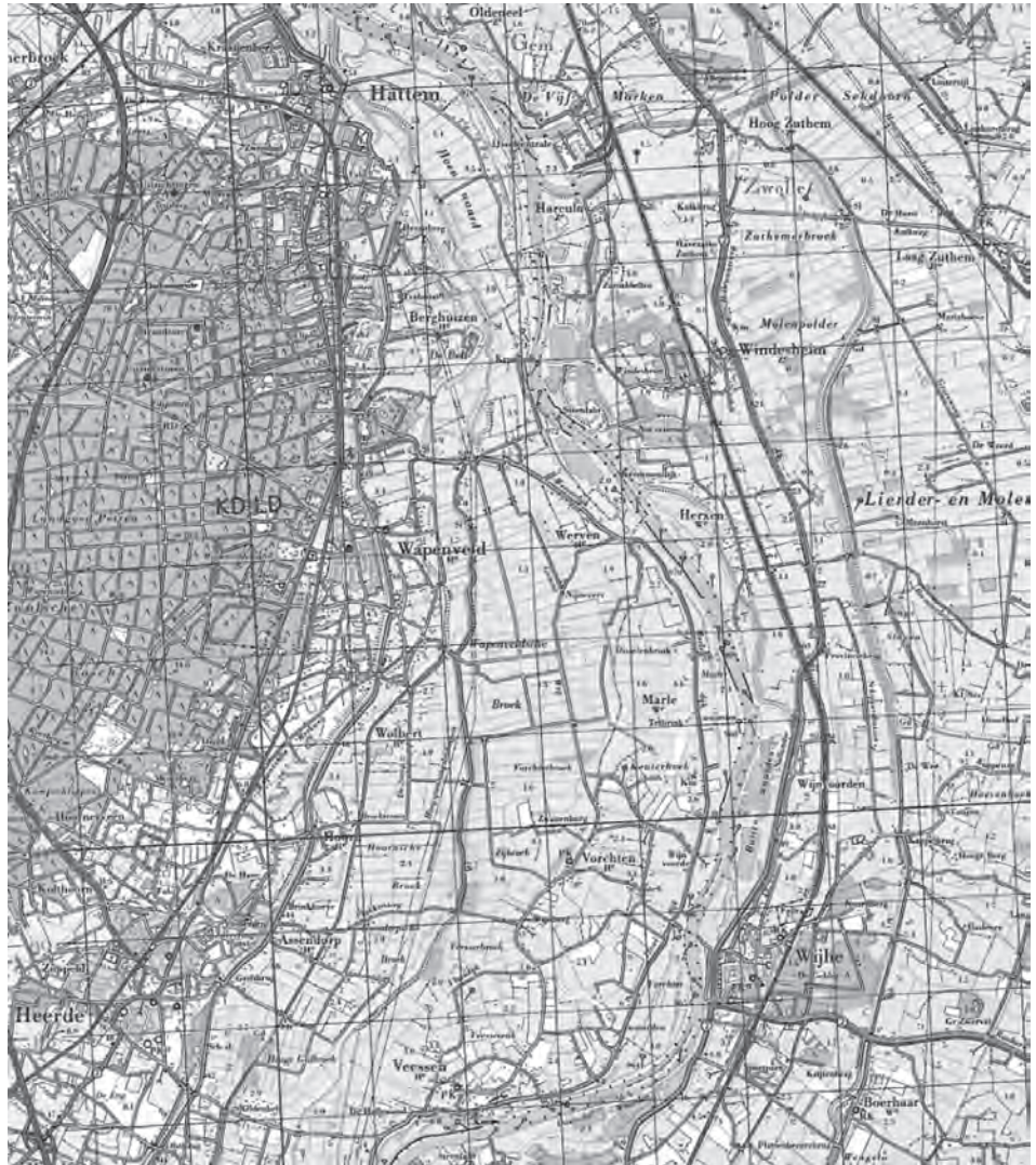
Afb. 5. Topografische kaart van het noordelijk deel van het waterschap met Heerde (met Veesen en Wapenveld) en Vorchten en de uitwatering in de Dwarsdijk tussen Werven en Hulsbergen (Wapenveld).

de grond aan de dijk grensde. Overigens was dit niet beperkt tot de individuele grondeigenaren maar ook van toepassing op het niveau van dorpen en buurtschappen. Dit was in de veertiende eeuw een betrekkelijk nieuwe ontwikkeling in de verhoefslaging van het dijkonderhoud, dat wil zeggen het omslaan van het dijkonderhoud of de kosten daarvan over alle grondbezitters in plaats van de aangelanden. Het is onduidelijk of deze bepaling gezien moet worden als een verwijzing naar een bestaande dijk langs de IJssel of dat die dijk nieuw was. In ieder geval moesten het dorp en de bewoners van Nijbroek bijdragen in het onderhoud ervan.