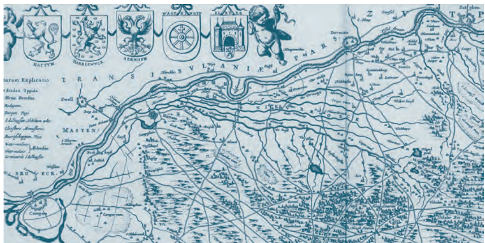
Afb. 1. Het Kwartier van Arnhem of de Veluwe (detail). Joan Blaeu, Atlas Maior (1665). Regionaal Archief Alkmaar.