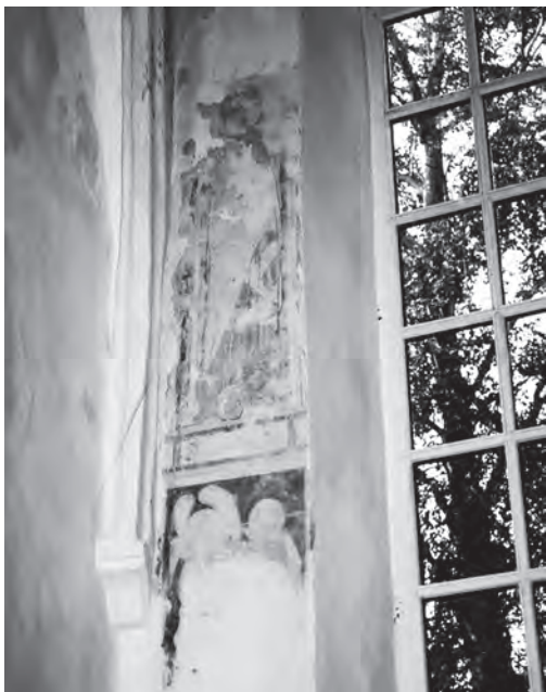
Afb. 2. Middeleeuwse muurschildering in de kerk van Nijbroek. Elf jaar na de uitgifte werd Nijbroek een eigen parochie (1339). De muurschilderingen werden eind jaren zestig van de twintigste eeuw aangetroffen bij de voorbereiding van restauratiewerkzaamheden.

In de uitgiftebrief van 1328 komen drie bepalingen voor die van belang waren voor de regeling van de waterstaat. De eerste bepaling stelde dat de andere dorpen hun water om het nieuwe richterambt Nijbroek heen moesten leiden. In een volgende bepaling werd vastgelegd dat als de aangrenzende dorpen gebruik wilden maken van de afwatering van Nijbroek, zij daarvoor een bijdrage moesten leveren. De eerstgenoemde bepaling had grote consequenties, want de andere dorpen maakten nieuwe waterstaatkundige werken nodig in de vorm van aanleg van weteringen en kaden. De nieuwe ontginning lag midden in de rivierkom. Ten westen ervan lagen reeds de dorpen Vaassen, Emst en Epe, waarvan