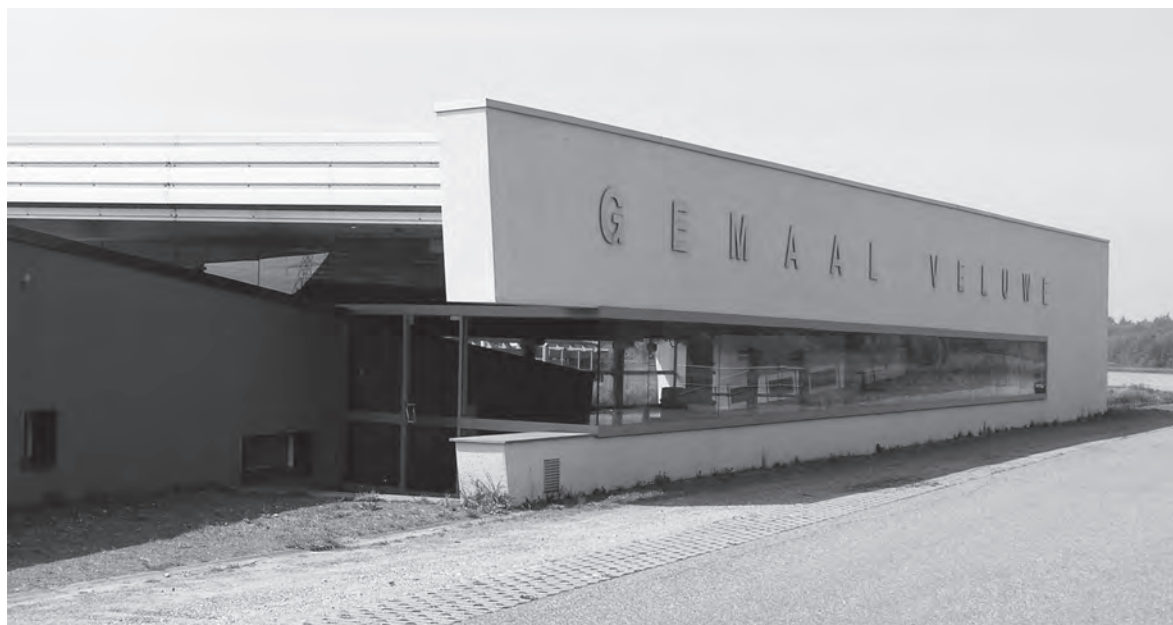
Afb. 7. Het nieuwe gemeaal Veluwe (sinds 1999).

De vorming en afronding van het waterschap is veel moeizamer verlopen dan elders in het Gelderse rivierengebied. Mogelijke oorzaak is de eilandenstructuur van de waterschappen in deze regio, die gekenmerkt werd door min of meer gesloten dijkringen. Ook de uitwatering viel daarbij onder jurisdictie van het waterschap. Daarentegen was op de Veluwe de uitwateringssituatie in de dijkrechten van 1370 en 1470 niet geregeld. Het waterschap Veluwe kreeg vooral hierdoor pas in de zestiende eeuw zijn uiteindelijke vorm. In 1838 werd het ingepast in het waterschapsreglement van de provincie Gelderland. Dat bracht grote veranderingen in organisatie en taken, maar de omvang van het gebied bleef hetzelfde. Het waterschap verdween als zelfstandige organisatie van de kaart met de oprichting van het waterschap Oost Veluwe in 1984. Dit fuseerde op zijn beurt in 1997 in het waterschap Veluwe. De volgende reorganisatie is momenteel reeds een besloten zaak. Op 1 januari 2012 gaan de ambtelijke organisaties van de waterschappen Veluwe en Vallei en Eem samen waarna op 1 januari 2013 de bestuurlijke fusie zal volgen (afb. 7).