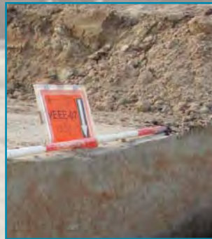
Oudste dijk Zeeland