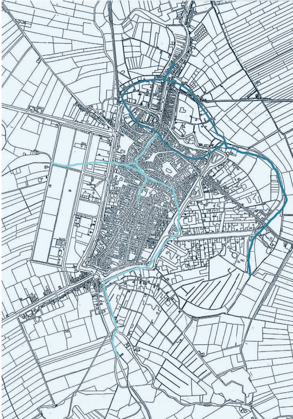
Afb. 2. Pre-kadastrale minuutplan van de stad Utrecht met omgeving, 1832. Met de vermoedelijke loop van de Rijn (lichtblauwe lijn) en die van de Vecht (donkerblauwe lijn), in de twaalfde eeuw voor de doorgraving van de Oudegracht Noordzijde en de Weerd circa 1165 en de stormramp van 1170.

het nedereind altijd het noordelijk deel, stroomafwaarts ten opzichte van het Domplein en aflopend naar de Zuiderzee, heeft betekend, moet ik hem daarin wel gelijk geven.