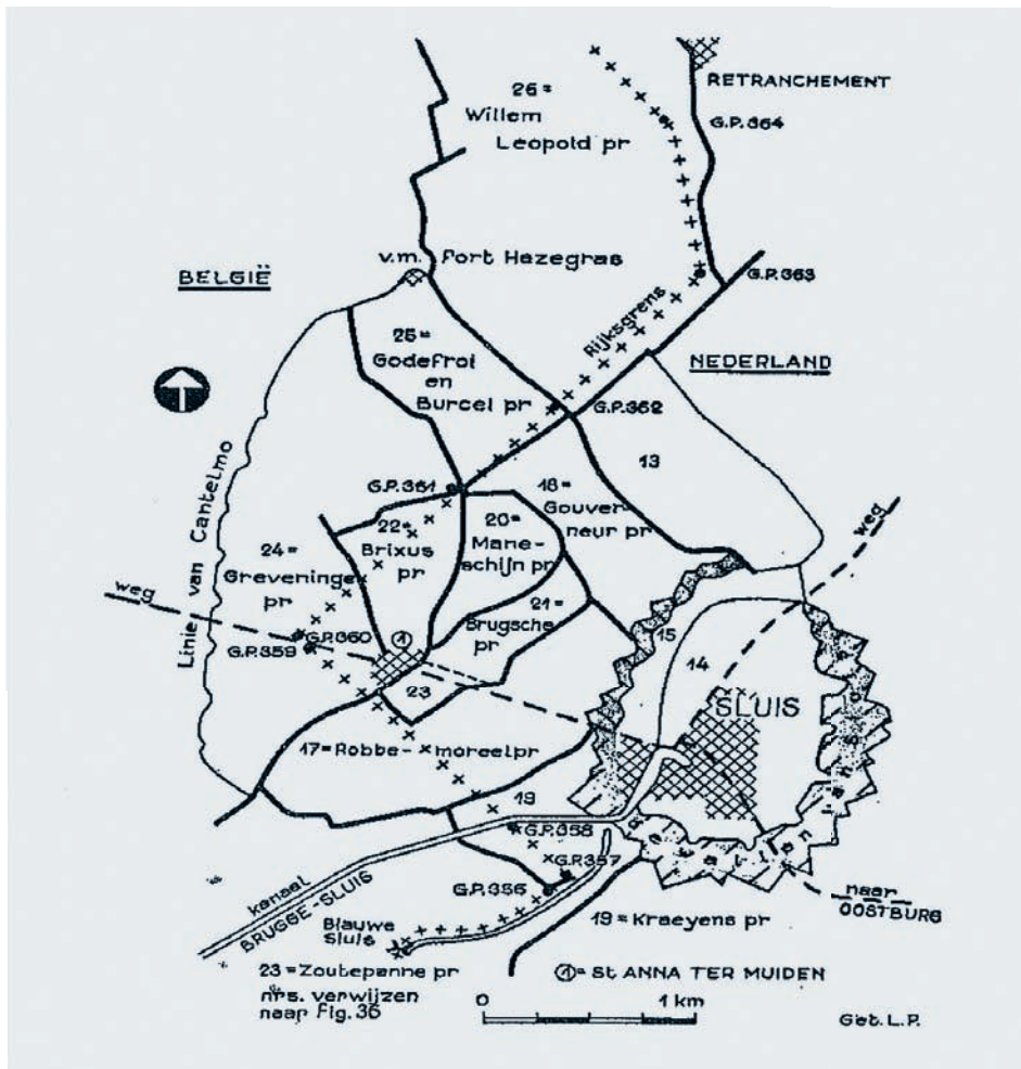
Afb. 3. Kaartje van een aantal internationale polders in de omgeving van het stadje Sluis in West-Zeeuws-Vlaanderen. De kruislijn is rijksgrens tussen Nederland en België.

In dit artikel werd aandacht geschonken aan het fenomeen van de internationale polders en waterschappen in Zeeuws-Vlaanderen. Die waren aanvankelijk ontstaan ten gevolge van de politieke ontwikkelingen in de zeventiende eeuw, waarbij de noordelijke en de zuidelijke Nederlanden in 1664 definitief van elkaar werden gescheiden. 23 In totaal zijn er in Zeeuws-Vlaanderen 23 polders/waterschappen geweest die deels ten noorden en ten zuiden van de in 1664 getrokken staatsgrens lagen. Het waren echter niet allemaal internationale polders/waterschappen in de bestuurlijke betekenis van het woord, te weten één bestuur dat bevoegd was over beide landsgedeelten. Soms gold deze omschrijving voor een polder waarvan slechts een miniem gedeelte aan de overzijde van de landsgrens lag. De Godefroi- en Burkelpolder ten noordwesten van het grensplaatsje Sint-Anna-ter-Muiden is daarvan een voorbeeld. Slechts 0,6 hectare van deze polder lag op Noord-Nederlands grondgebied.