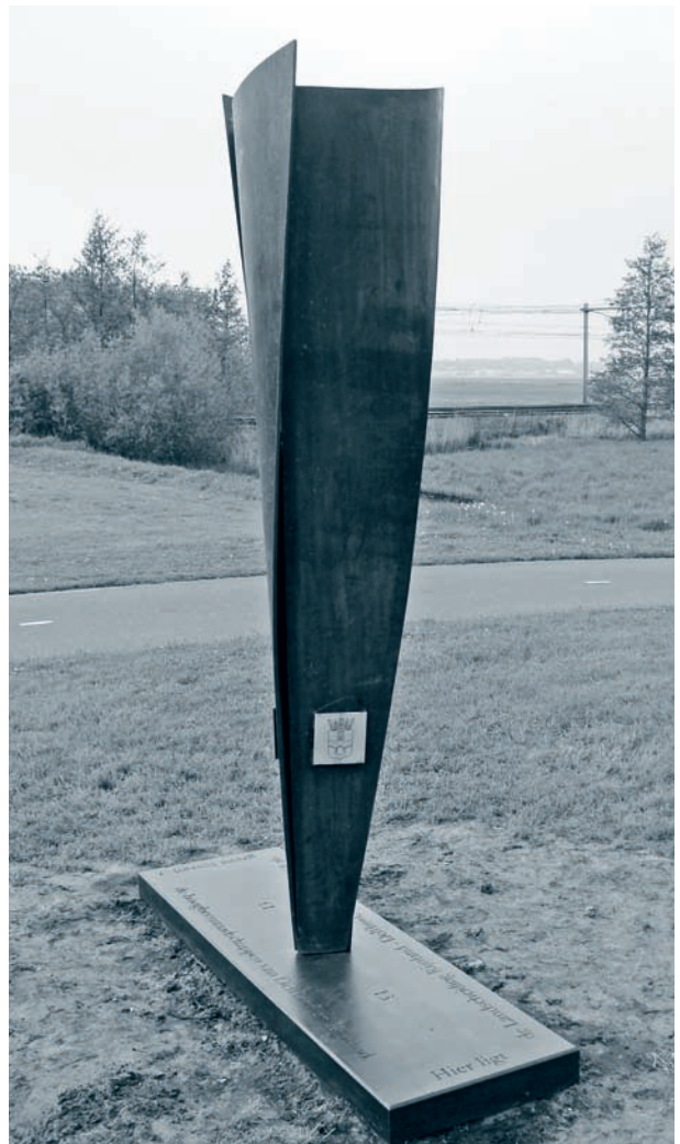
De nieuwe grenspaal in Leidschendam.

De hoogheemraadschappen van Delfland en Rijnland werken samen met de gemeente Leidschendam-Voorburg aan diverse projecten in het kader van het Waterplan. De herontwikkeling van de lange strook grond langs de spoorbaan tot 'waterspoorparken' met een goede waterbeheersing maakt hier deel van uit. De strook doorkruist de eeuwenoude landscheiding tussen Rijnland en Delfland. De serie grenspalen die deze grens markeert is nog nagenoeg compleet. Maar juist langs het spoor ontbrak een grenspaal, mogelijk verdwenen bij de aanleg van het Sijtwendetunnelcomplex in Leidschendam enkele jaren geleden. De succesvolle samenwerking werd aangegrepen om een nieuwe te plaatsen. Beeldend kunstenaar Natalie Lorenz ging aan de slag en ontwierp een moderne variant op het aloude thema 'grenspaal'. Het in cortenstaal uitgevoerd kunstwerk werd op 30 mei 2013 onthuld. Het is voorzien van het volgnummer van de verdwenen paal en de wapens van Rijnland, Delfland en de gemeente. In de betonnen voet is uitleg over de landscheiding aangebracht.