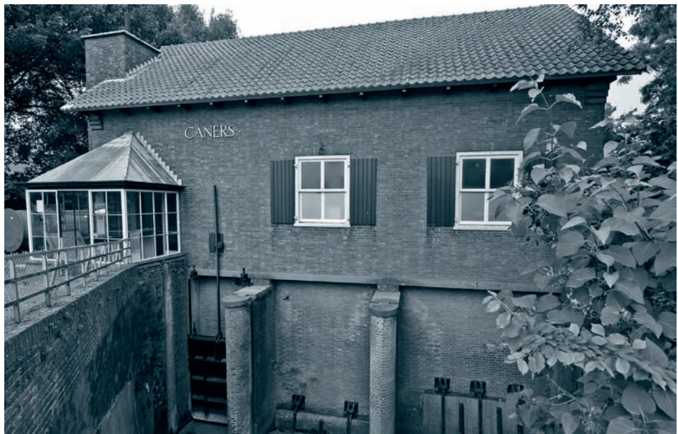
Gemaal Caners.

Waterschap Aa en Maas stelt tot met oktober iedere laatste zondagmiddag van de maand het museumgemaal Caners in Gewande bij Den Bosch open voor het publiek. In het gemaal is een expositie te zien over zeven eeuwen waterbeheer. Het gemaal zelf is echter ook zeer de moeite waard. Het dateert uit 1933 en werd opgetrokken naar plannen van ingenieursbureau Van Hasselt en Koning in Nijmegen. Het goed geproportioneerde gebouw vertoont qua architectuur zowel traditionalistische als functionalistische invloeden. Het gemaal was uitgerust met een dieselmotor voor de kleine pomp en een elektromotor voor de grote. De laatstgenoemde motor is nog aanwezig, maar buiten bedrijf. De diesel werd in 1953 vervangen door een ander, een tweecilinder van het fabricaat Stork-Thomassen. Deze motor was toen al twintig jaar oud, werd overgeplaatst uit het gesloopte gemaal Orthen in Den Bosch en is tegenwoordig nog steeds bedrijfsklaar. Gemaal Caners deed dienst tot 1979. Drie jaar later kreeg het een museumfunctie en sinds 2001 staat het op de Rijksmonumentenlijst. Tijdens de openingsuren wordt regelmatig de oude dieselmotor gestart. www.aaenmaas.nl .