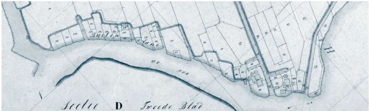
Afb. 4. Kadastrale minuut 1832, Alkemade, Sectie A blad 03. Onderaan de voormalige Wendeldijkshoek.

In 1297 wordt de Wendeldijk genoemd als graaf Jan I aan het klooster van Leeuwenhorst een uiterdijk 55 van de Wendeldijk schenkt, grenzend aan land dat het klooster al in bezit had. 56 Ook deze vermelding zou op hetzelfde eiland betrekking kunnen hebben omdat uit een kaartboek uit het begin van de zeventiende eeuw blijkt dat de abdij op dit eiland een perceel land in bezit had dat toen aan een poel gelegen was (afb. 5). 57 Op 6 juli 1308 gelast graaf Willem III de baljuw van Rijnland het klooster in het bezit van de uiterdijk te handhaven tegen eenieder “uten kercspele ende ute ambochte van Warmonde of anders”. 58 Ook deze vermelding sluit aan bij een Wendeldijk gelegen op het eiland omdat diverse percelen naast dit eiland tot het ambacht Warmond behoorden.