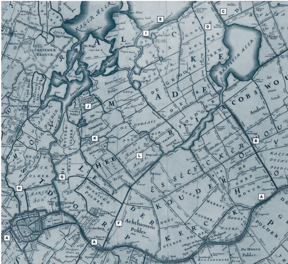
Afb. 1. Deel van de overzichtskaart van Rijnland uit 1647. A = Rijn; B = Heimans- of Woudwetering; C = Oude Wetering; D = Goog; E = voormalige Leidse Meer; F = Does; G = Zijl; H = Mare. I = Wendeldijkshoek; J = Vrije Boekhorst; K = Vrouwenne of Vrouwenveen; L = Hoogmaade.

wetering lopende Goog ziet hij als de derde wetering. 8