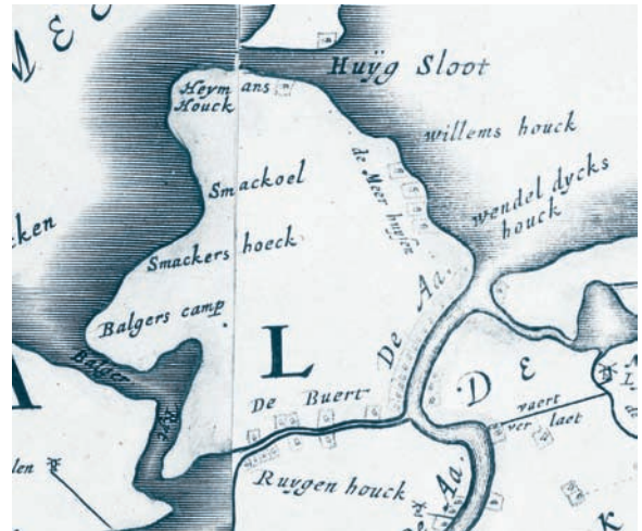
Afb. 3. Vermelding ‘wendel dijcks houck op het eiland ‘na de Buert’. Detail uit de overzichtskaart van Rijnland uit 1647. Beeldbank Hoogheemraadschap van Rijnland A-4276.

Het Oud Nederlands Woordenboek kent aan ‘wendel’ de betekenis ‘bocht’ toe. 53 De Wendeldijk zou zijn naam dan aan deze ‘hoek’ of bocht in de dijk kunnen ontleen, vergelijkbaar met de middeleeuwse naam Wendelnesse voor Puttershoek. 54 Een alternatieve verklaring voor de naam Wendeldijk volgt uit de oudste gedetailleerde kaart van het eiland, de kadastrale minuut van 1832 (afb. 4). Op het dan al een aantal eeuwen ingepolderde eiland slingert een deel van de dijk nog steeds achter een aantal buitendijkse percelen. Misschien bestond deze situatie ook al in de middeleeuwen op het toen veel drukker bewoonde eiland en boden deze percelen toen plaats aan huizen van vissers of scheepswerven.